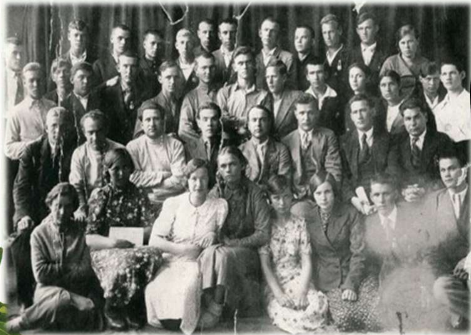
Выпускники и учителя школы №1 1939 г., ушедшие на фронт и работавшие в тылу